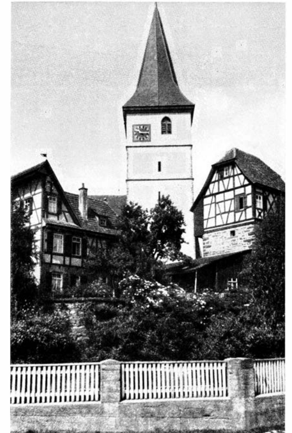
Merklingen, Blick über den ehemaligen Graben auf überbaute Teile der Wehrmauer, Rechteckturm und Kirchturm