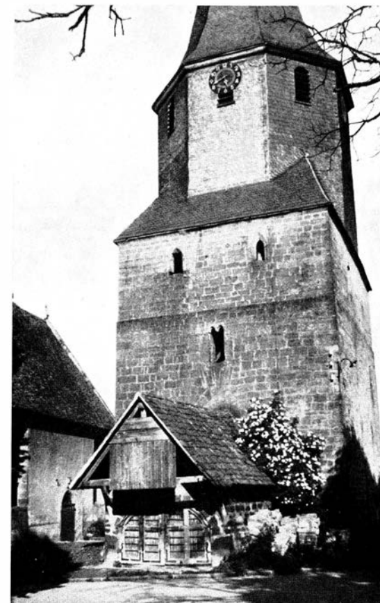
Derdingen, das in einen Turm verwandelte Steinhaus; links das Schiff der Kirche

Geschichtlich gesehen, kann die Bildung der Wehrkirchen auf herrenalbischem und maulbronnischem Boden als Ablösung eines festen Herrenhofes des Ortsadels angesehen werden. Bei den wehrhaften Pfleghöfen mit Steinhäusern dürften wir Formen von „Grangien“ vor uns haben; ist doch 1247 in bezug auf Derdingen die Rede „de Grangie monachorum de Alba ibidem site“. Solche Grangien sind klöster-