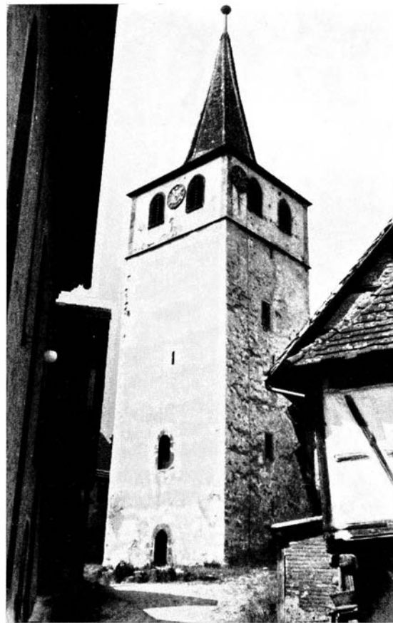
Weissach, Blick auf den Kirchturm zwischen Schiff und Gaden

Verbindung der Gemeinde mit der Kirchhofsbefestigung in Erscheinung. Zwar zahlt bei Bauten am Kirchgraben der Abt die Maurer und Steinmetzen; die Merklinger aber müssen dabei fronen und für Sand, Kalk und Steine sorgen. Bei der 1797 geplanten Veränderung des Kirchgrabens gab es einen großen Aufstand. Damit stimmen die Beobachtungen, die wir andernorts machen, überein.