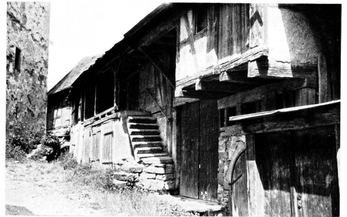
Weissach, Gaden mit Teil des Kirchturms

Im nahen Weissach erhielt 1250 das Zisterzienserkloster Maulbronn einen Teil der Ortsherrschaft von den Grafen von Vaihingen, während der Kirchensatz erst 1360 über die von Enzberg an das Kloster kam, wohl aus den Händen des Ritters Berthold Strubecho, der auf der nahen Burg Kapfenhart gesessen haben dürfte, die schon 1299 an das Kloster kam und niedergerissen wurde. Einer Urkunde vom 1. Juli 1254 nun entnehmen wir Einzelheiten, aus denen hervorgeht, daß damals schon die heutige Wehrkirche in Entstehung begriffen gewesen sein könnte. Es wird nämlich den Bauern ausdrücklich untersagt, ohne Erlaubnis des Patronatsherren und des Pfarrers weder einen Turm (turrim) noch irgend eine Befestigung (munitionem) vorzunehmen. Hieraus geht deutlich hervor, daß die Bauern mindestens die Absicht hatten, ungefragt ihre Kirche in eine Wehranlage zu verwandeln. Nicht zuletzt können wir hieraus wiederum auf den Anteil der Dorfgenossenschaften an der Entstehung der Wehrkirchen schließen. Eine andere Stelle in jener Urkunde weist sogar schon auf die Voraussetzung der Entstehung von Gaden; hier heißt es, daß auf der anderen Seite Patronatsherr und Pfarrer die Bauern nicht daran hindern dürfen, ihr