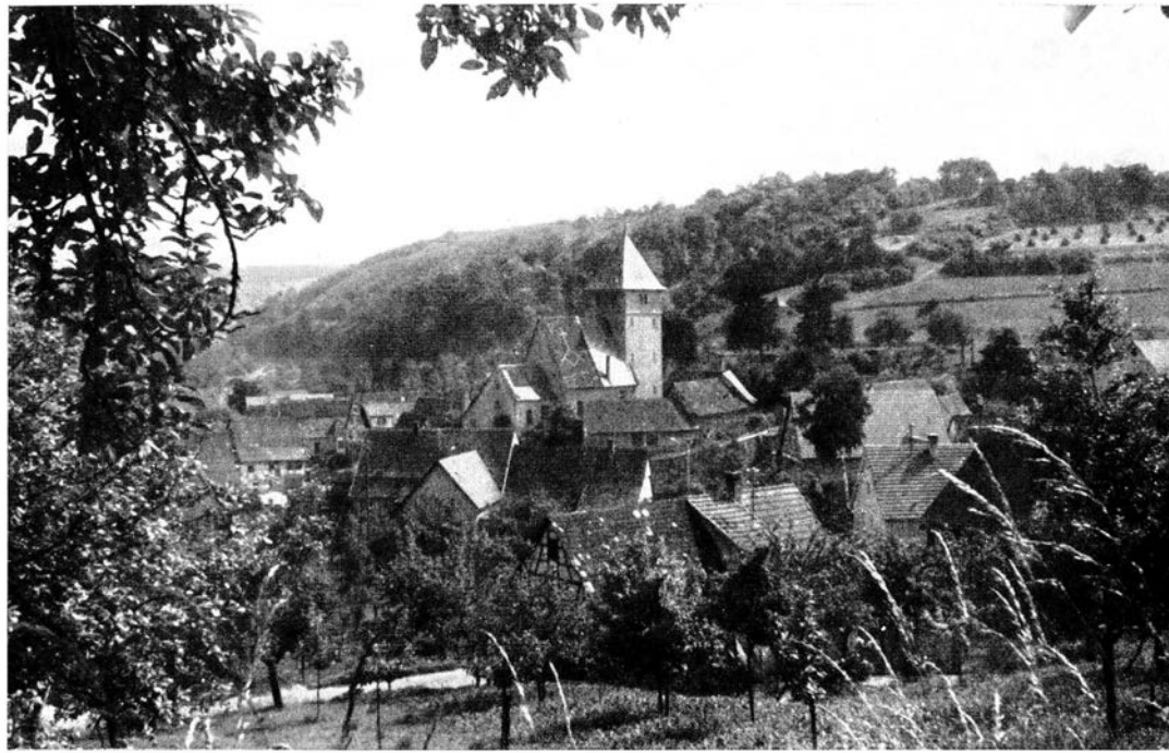
Iptingen, Wehrkirche mit dem Ring der Gaden