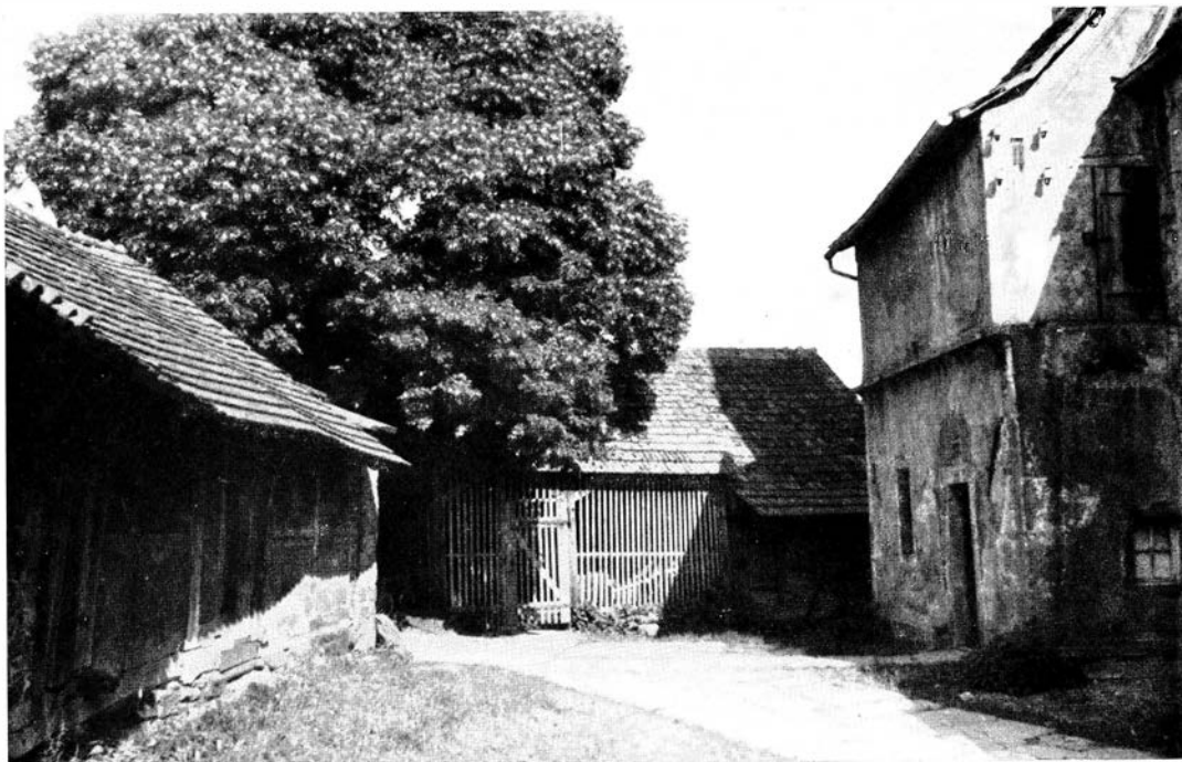
Lienzingen, Gaden im Wehrkirchhof